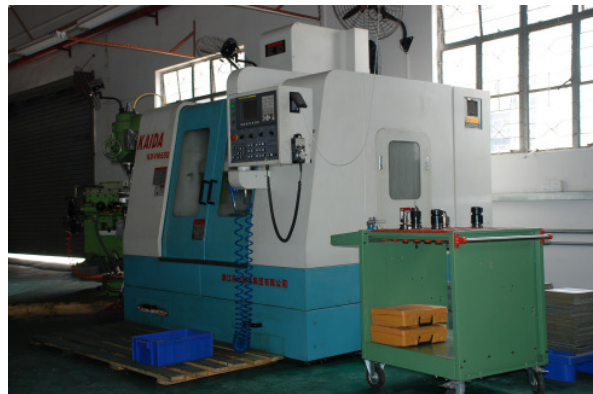
Die Kapazitäten wurden vor allem im Bereich Drehen, Fräsen und bei der Nachbearbeitung von Gussteilen ausgebaut. Besonders bei qualitätssensiblen Teilen oder bei Termindruck kommt der Vorteil der Eigenfertigung deutlich zum Tragen.

Die neue Eigenfertigung hat sich bereits heute bewährt und soll weiter ausgebaut werden. Im Besonderen beim Werkzeug- und Vorrichtungsbau sollen die Eigenkapazitäten zukünftig deutlich vergrößert werden. Die Etablierung einer eigenen Prototypenanlage sowie Investitionen in eine eigene Druckgussanlage befinden sich momentan in der Planung.