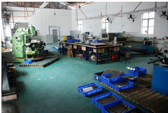
Die neue eigene Fertigung ist auf zwei Firmenhallen verteilt und befindet sich im chinesischen Zhong Shan unter deutscher Leitung.

Die chinesische Stadt Zhong Shan liegt in der Provinz Guangdong im Perflussdelta, welches eine der drei wichtigsten Wirtschaftsräume Chinas darstellt und mittlerweile die größte Industrieregion der Welt ist. China bleibt als zweitgrößter Gussproduzent der Welt und drittgrößter Markt für Industriewerkzeuge nach wie vor ein wichtiger Markt für uns.